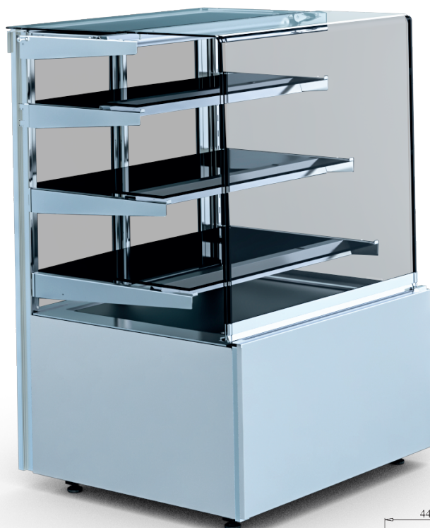
CUBE (W) 3P

Cube 0.6 slagdörr med valfri dörrhängning Andra alternativ på frontlaminat offereras.