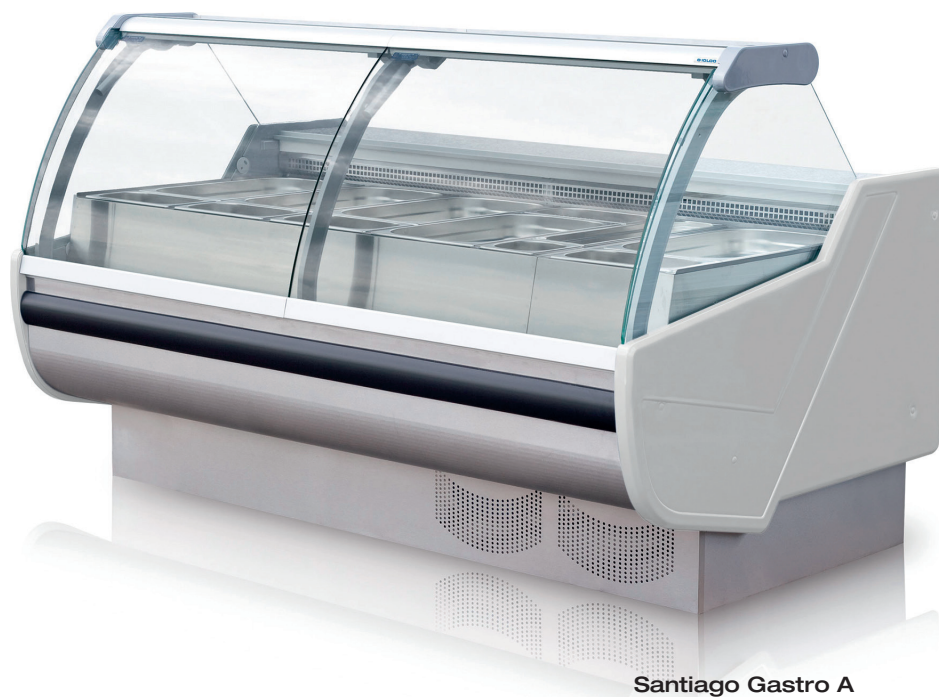
Santiago Gastro A