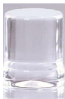
Ø 27 x 32