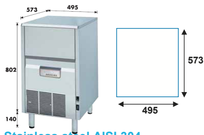
Stainless steel AISI 304